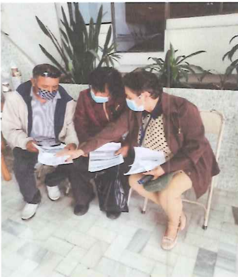
Orientando a maestros para obtener el inventario de cuentas

Se generaron fotocopias de DPI de los artistas que no tenían una ampliación del mismo, también se generaron inventarios de cuentas de los maestros que no podían hacerlo, se generaron fotos cuando estas fueron insuficientes para demostrar su récord artístico.