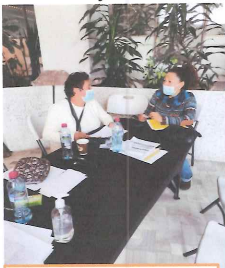
Recepción De Documentos

Se atendieron a los maestros que se presentar8on en las instalaciones Del Teatro Nacional Miguel Ángel Asturias, y se les recepcionaron los documentos solicitados para ser tomados en cuenta en la iniciativa Apoyarte, luego se procedió a conformar los expedientes de los artistas que cumplían con los requisitos solicitado luego de ser revisados ordenados se trasladaron a la mesa de registro para que seguir con el proceso de calificación para ser ministerio de cultura y deporte.